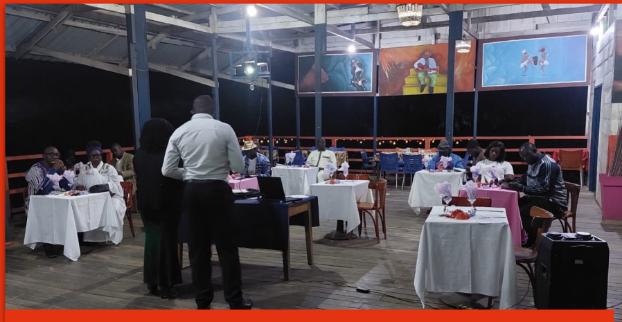
Photo d'un Parcours Couple au Cameroun