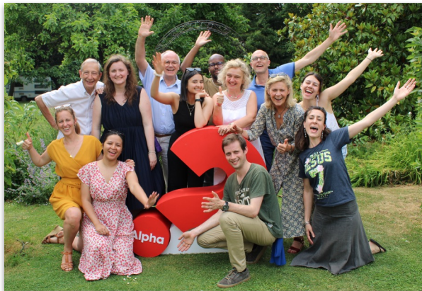
L'équipe de permanents d'Alpha

Pour réaliser ce rêve, nous nous appuyons sur différents leviers :